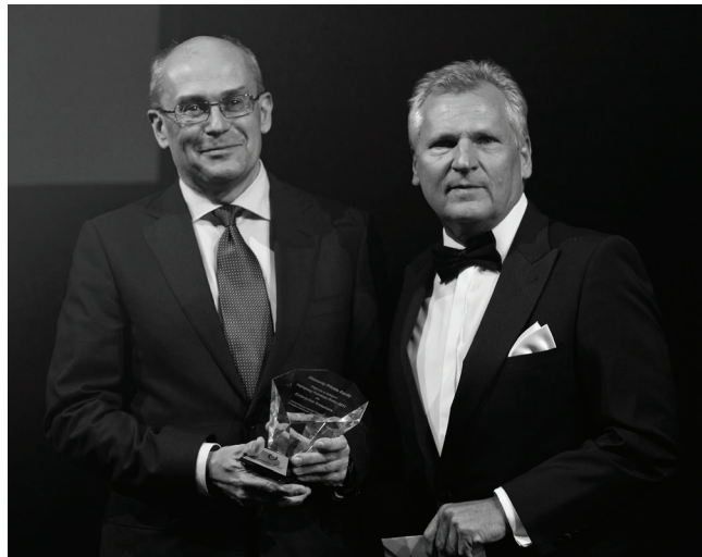
Zľava: J. Siwicki; A. Kwaśniewski, bývalý poľský prezident